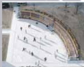
Alecks: tai ji quan