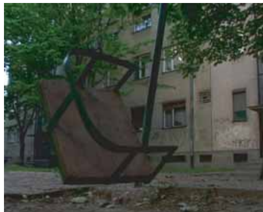
Miloš Pušić: Tag