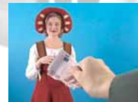
Ane Lan: Europa