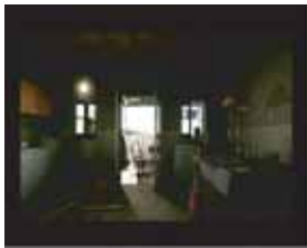
Martijn Veldhoen: Momentum